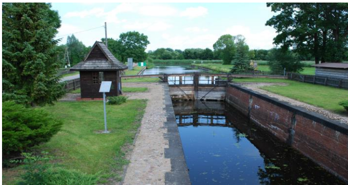
Augustavo rajonas, Denbovo šliuzas

Pavyzdžiui, Denbovo šliuzas - pirmasis Augustavo kanale iš Bebros upės pusės. Jis yra kanalo 0,35 kilometre, statytas 1826-1827 m., turi vieną kamerą, vartai mediniai. Lygių skirtumas - 2,07 m; ilgis - 43,9 m; plotis - 6,10 m. Tai vienintelis istorinis šliuzas pietinėje kanalo atkarpoje.