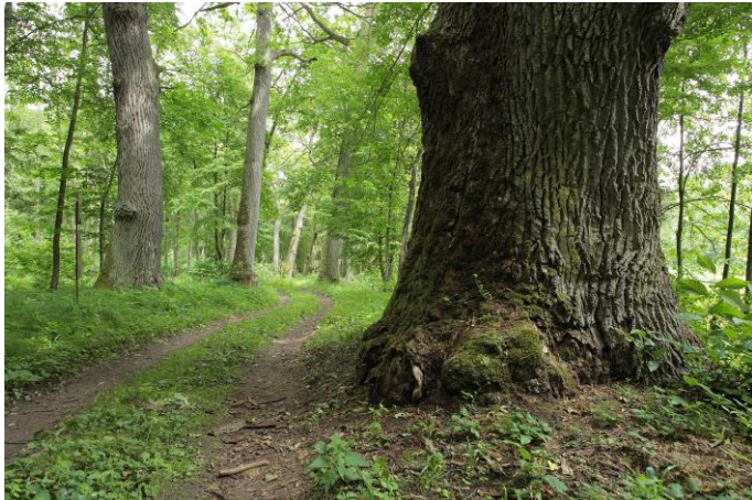
Ažuolų alėja.

Pakeliui Radžiūnų ir Alytaus piliakalniai, Alovės atodanga, toliau esantis Poteronių piliakalnis; Vidzgirio botaninis draustinis. Alytuje taip pat lankykime kraštotyros muziejų, pramogų parką, bažnyčias, buvusią geležinkelio stotį, aukščiausią pėsčiųjų tiltą per Nemuną ir kitus objektus.