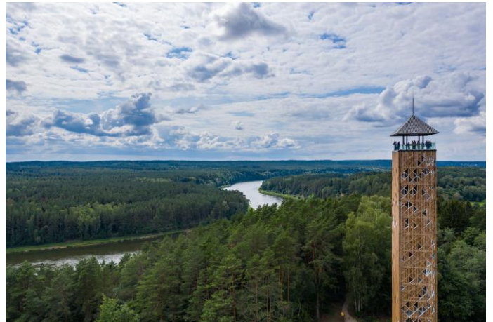
Nemuno kilpos ir apžvalgos bokštas.

paminklą valdovui Vyteniui, toliau – Žarijų piliakalniai.