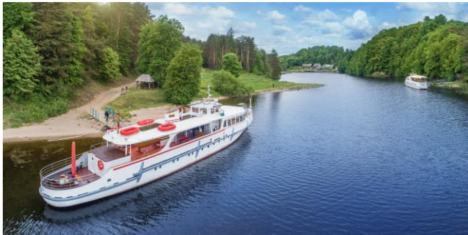
Prie Rumšiškių.

„Kaimynines šalis jungiančio bendro vandens kelio vystymas tvariam turizmui ir bendradarbiavimui“