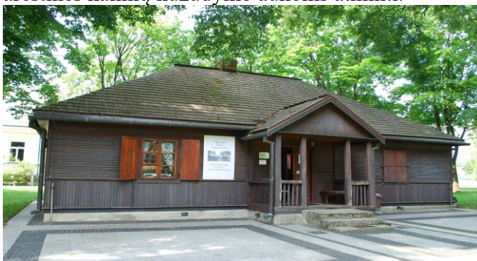
Augustavo kanalo muziejus